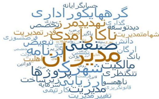
تصویر شماره ۱: ابر واژه مستخرج از ۳۲ مصاحبه در نرم‌افزار NVIVO

تصویر ۱ نشان‌دهنده لغات پرتکرار (word frequency) در مصاحبه‌های انجام گرفته است که در نرم‌افزار Nvivo استخراج شده است.