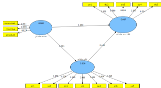
شکل شماره (۲): ضرایب تعیین و ضرایب مسیر مدل پژوهش

نتیجه حاصل از محاسبه میزان شاخص نیکویی برازش مدل پژوهش حاضر نشان می‌دهد، این مقدار برابر ۰/۴۰ بوده است که نشان‌دهنده برازش خوب مدل مفهومی این پژوهش است.