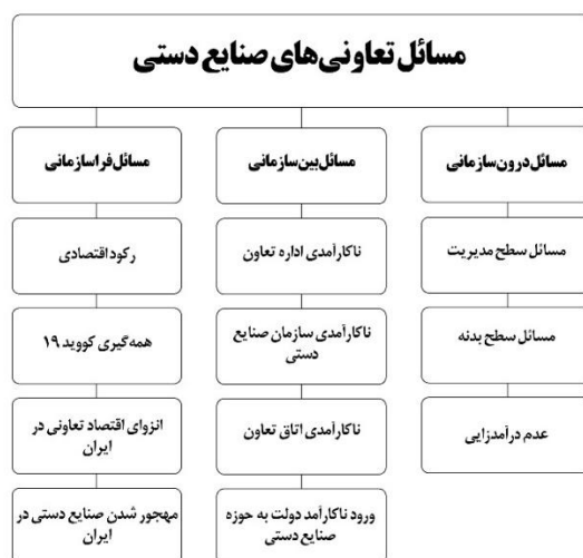
نمودار ۱: مسائل تعاونی‌های صنایع دستی

مسئله از آنجایی شروع می‌شود که تعاونی‌ها دیگر تعاونی نیستند و از انجام وظایف تعاونی ناتوان‌اند. به همین خاطر دیگر موضوعیتی ندارند، و گویا به همین دلیل خودبه‌خود تعطیل شده یا به حالت تعلیق درآمده‌اند. از جمله وظایف اصلی تعاونی‌های صنایع دستی، تأمین مواد خام و مواد اولیه موردنیاز صنعتگران و هنرمندان است که همه افراد مصاحبه‌شونده در پژوهش بر این نظر بودند که تعاونی‌ها از عهده این وظیفه برنمی‌آیند. حمایت از صنعتگران برای فروش محصولات و وظیفه دیگری است که آن‌هم از توان تعاونی‌ها خارج شده است. عدم دسترسی تعاونی‌ها به مواد اولیه صنایع دستی از یک‌سو تحت تأثیر تحریم‌ها و عدم واردات مواد اولیه و از سوی دیگر تحت تأثیر برخی ناکارآمدی‌های داخلی است. مسائلی که منجر به ناکارآمدی و حتی تعطیلی برخی تعاونی‌های صنایع دستی در اصفهان شده به سه دسته عمده تقسیم می‌شوند. این سه عبارت‌اند از مسائل درون‌سازمانی تعاونی‌ها، مسائل بین‌سازمانی (بین تعاونی‌ها و دیگر سازمان‌های مرتبط)، و مسائل فرا سازمانی که فراتر از سازمان خاص و در سطح کلان بر این روند اثرگذار هستند. در ادامه هرکدام از این دسته‌ها مورد بررسی قرار گرفته و به جزییات آن‌ها و نقل‌قول‌هایی از سوی مشارکت‌کنندگان اشاره می‌شود.