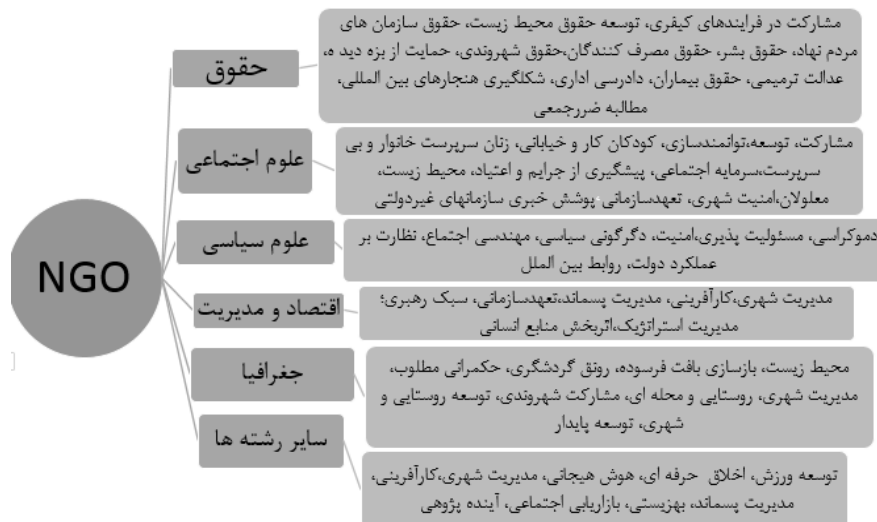
شکل (۲) موضوعات مورد پژوهش در رابطه با سمن‌ها در مطالعات پیشین به تفکیک رشته

دسته دوم تحقیقاتی است که در آن‌ها سمن‌ها به‌عنوان متغیر مستقل و تأثیرگذار مطرح شده‌اند. در این پژوهش‌ها به بررسی عملکرد و تأثیرات سمن‌ها بر موضوعات و مسائل اجتماعی، سیاسی، حقوقی و... پرداخت شده است. در مورد این تحقیقات نقطه حائز اهمیت این بود که اکثریت قریب به اتفاق این تحقیقات فاقد مبنای نظری دقیق در مورد ملاک‌های ارزیابی و سنجش عملکرد سمن‌ها بودند و تعریف دقیقی از معنای موفقیت سمن ارائه نشده بود.