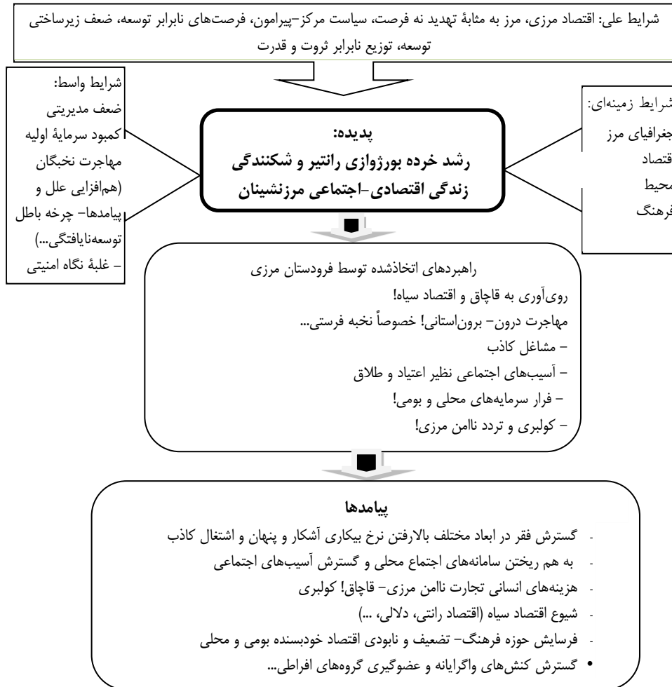
شکل (۱) نمودار پارادایمی پژوهش