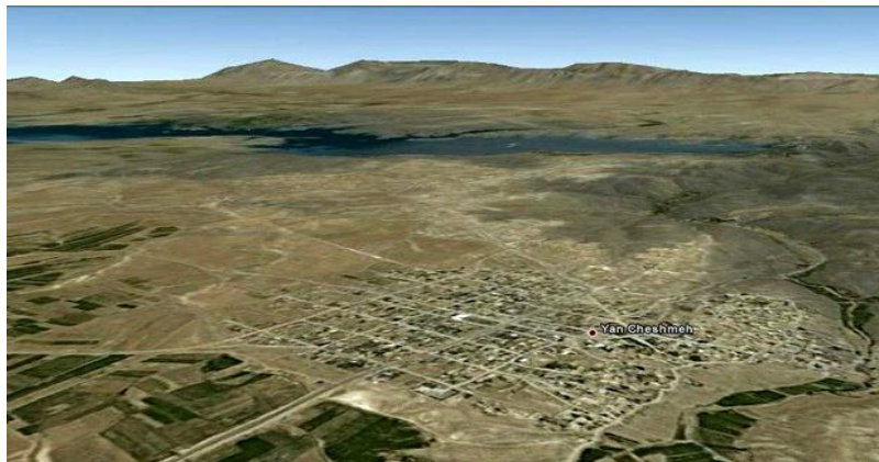
شکل ۳-۱: تصویر هوایی روستای یانچشمه

یانچشمه روستایی است در شهرستان ین استان چهارمحال و بختیاری که البته قبلاً بخشی از شهرستان چادگان و استان اصفهان بوده است. در سال ۱۳۹۱ شمسی با تصویب هیئت دولت روستایانچشمه به‌عنوان مرکز بخش شیدا تصویب گردید. این مصوبه با توجه به مصوبه دولت در خصوص ارتقاء بخش بن به شهرستان صورت گرفت. این روستا در کنار زاینده‌رود و دریاچه پشت سد زاینده رود قرار گرفته است به همین جهت موقعیت مناسبی برای گردشگری و پذیرش توریست در تابستان‌ها دارد. مردم این شهر به لهجه مختص خویش از گویش‌های جنوب‌غرب از ترکی اوغوز سخن گفته و شیعه دوازده‌امامی می‌باشند (بانک اطلاعاتی روستاهای ایران، ۱۳۹۱: ۳).